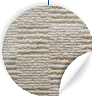
Farbe und Struktur des Produkts