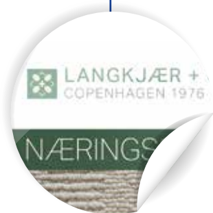
Firmenlogo in den Markenfarben