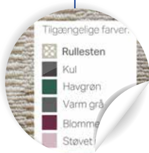
Weitere in der Produktreihe verfügbare Farben